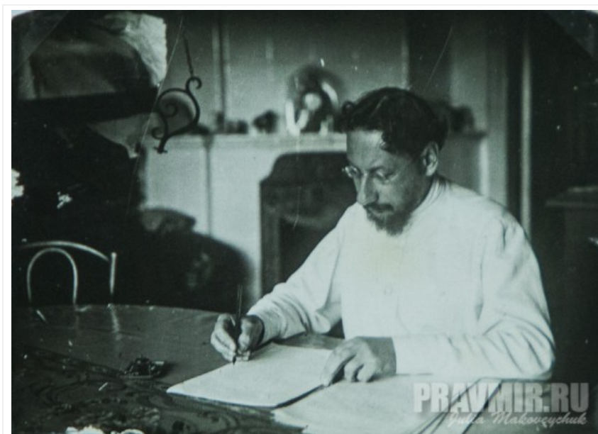
Священник Павел Флоренский

Он раскрывает вещи, которые человек без духовного опыта и богословских знаний не сразу может понять у святых отцов, говорит нашим языком, используя все накопленные человечеством научные знания, не останавливается, доходит до предела, утверждает: Троица-Единица — абсурд, но это и есть Божественная Истина. Либо ты в это веришь, либо нет.