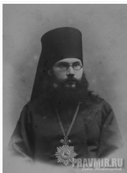
Архиеп. Феодор (Поздеевский)

чтобы раскрыть какие-то важные стороны духовной жизни, и был по-настоящему православным. А вот об отце Сергии Булгакове, о его творении он сказал так: „Есть такие яблоки, сорт джонатан, с виду такие красивые, а не очень-то они полезные — кто ест, у того генетика меняется. То есть бесполезно Булгакова читать, могут застрять какие-то его теологумены в голове и повредить душе“» (Стр. 103–104).