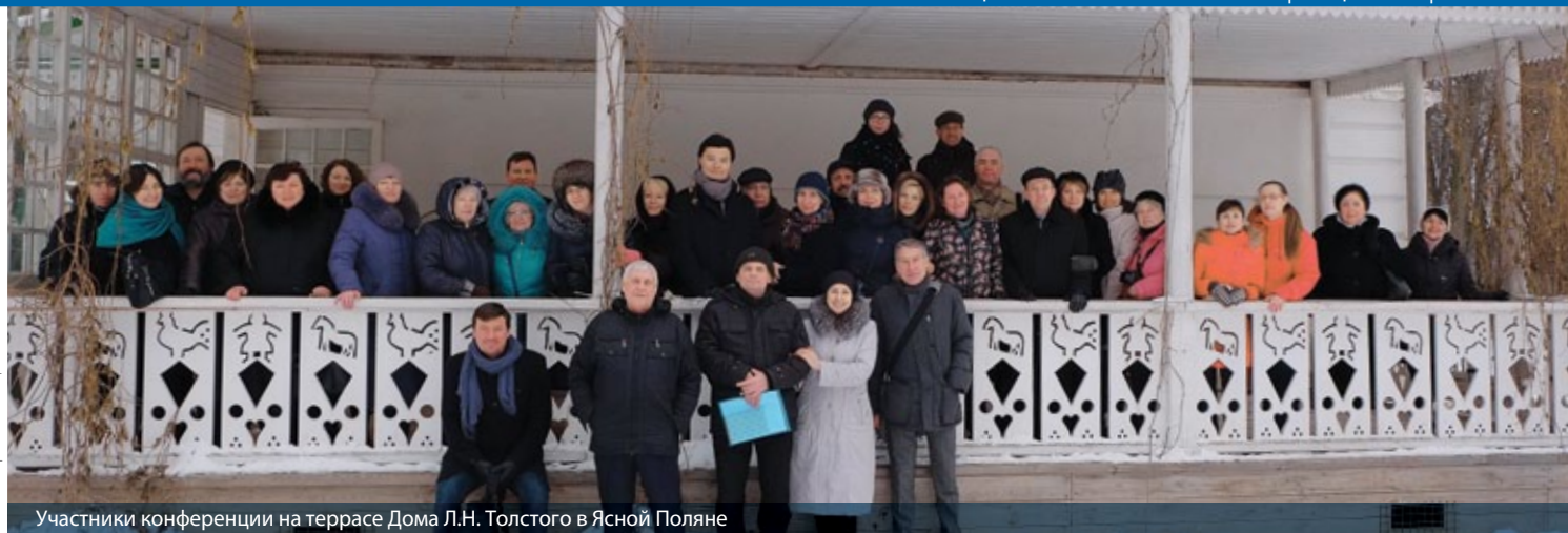
Участники конференции на террасе Дома Л.Н. Толстого в Ясной Поляне