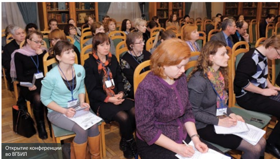
Открытие конференции во ВГБИЛ

Создание музея даёт возможность рядовой публичной библиотеке обрести своё творческое лицо, позволяет ей не затеряться на современной культурной карте, существенно повышает ценность и востребованность её фондов, которые включают не только общедоступные издания, но и мемориальные книжные коллекции или специализированные библиотечные собрания, связанные с личностью, событием, местом, которые чтит библиотека. Более того, музей при библиотеке существенно расширяет спектр её деятельности, прибавляя к традиционным формам библиотечной работы те, которые выходят в музейную и архивную сферы: создание экспозиций, проведение экскурсий, собирание мемориальных коллекций и архивных документов, исследовательскую и издательскую работу. Разнообразится — в смысловом и жанровом отношении — культурно-просветительная деятельность библиотеки.