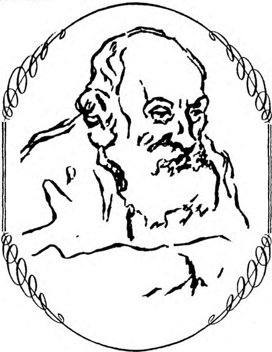
Н. Ф. Федоров Набросок худ. Л. Пастернака