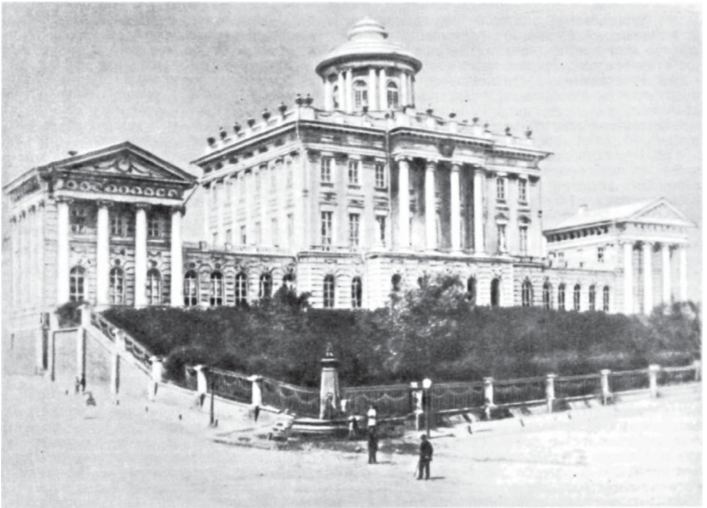
Московский публичный Румянцевский музей

кая задача, направленная на область чувства, без разрешения которой одним умом на «общее дело» не сдвинешься. А чувство должно быть столь большим, по Федорову, чтобы переориентировать всю свою жизнь назад, к предкам. Пробудить чувство всеобщей родственности Федоров стремится указанием на культ предков, как единственно истинную религию. Но, «если религия есть культ мертвых, то это не значит почитание смерти, напротив, это значит объединение живущих в труде познания слепой силы, носящей в себе голод, язвы и смерть, в труде обращения ее в живородящую» (I, 48). Вспомним о том детском чувстве недоумения и боли от открытия того, что не все родные, которое отметил Николай Федорович в своей автобиографической заметке. Отношение ребенка к узнаваемому им миру ближних, как ко все расширяющемуся кругу родных, должно стать нормой для всех. В нем не осознанно, не рефлексивно, а всем трепещущим детским существом творится живой обряд «культа предков». «В детском чувстве всеобщего братства заключалось, что каждый человек есть сын, внук, правнук, праправнук, потомок отца, дедов, прадедов,