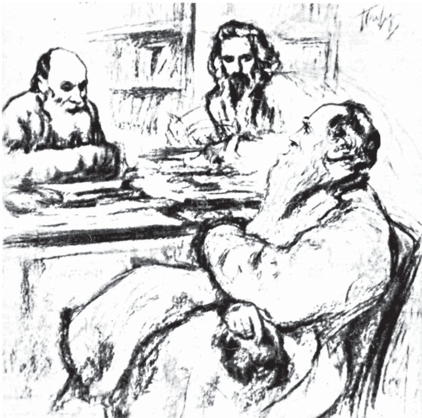
Н. Ф. Федоров, Л. Н. Толстой и В. С. Соловьев Художник Л. Пастернак