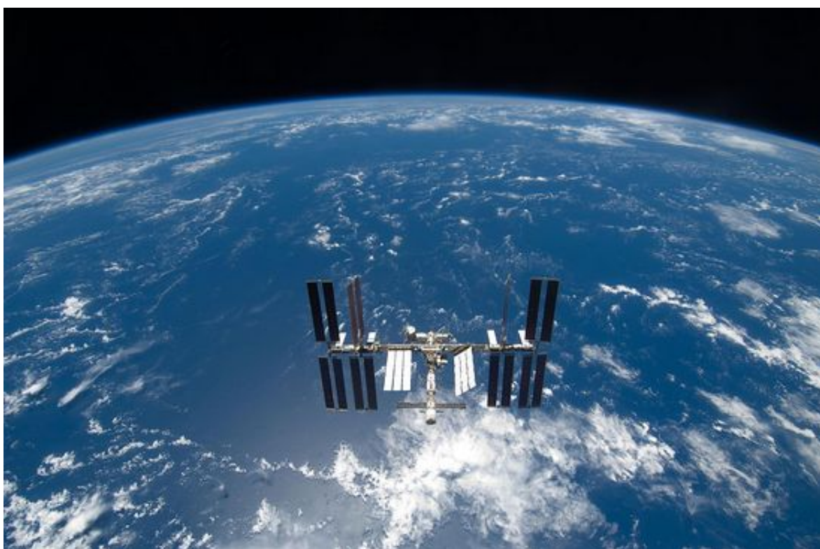
Международная космическая станция (МКС). Снимок американских