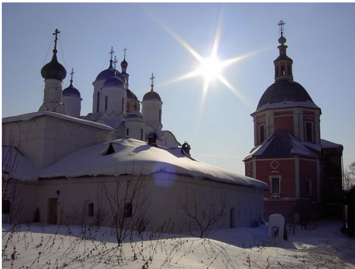
В Свято-Пафнутьево-Боровском монастыре

И Благовещенская церковь калужского городка Боровска ведет беседу с Константином Циолковским, присутствующим рядом и в виде настенной росписи, и в виде памятника ученому, основоположнику русской и всемирной космонавтики.