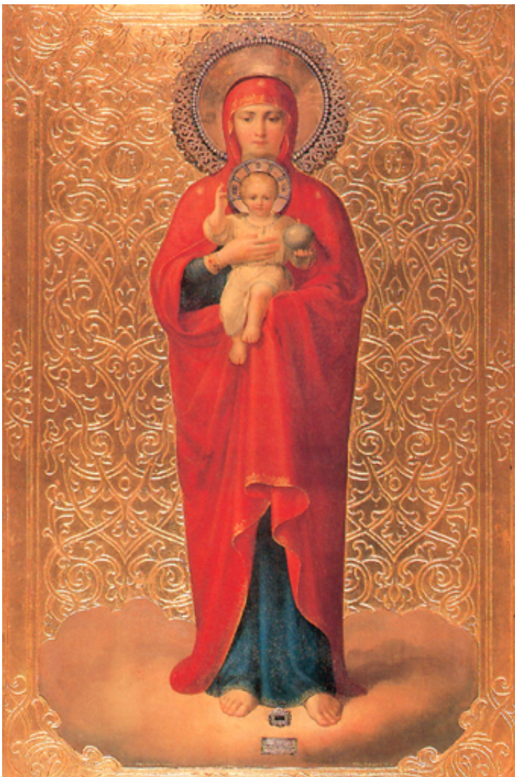
Пресвятая Богородица Валаамская. Икона XIX в.

Даром что 200 лет прошло с гоголевского восклицания про Русь-тройку, и русский человек уже пересел на механическую лошадку, да и первым на планете вышел в космос . Ан вот загвоздка: цивилизация ломится во все двери, а живую лошадку он тоже не позабыл, и к отдохновению в среде природы его стало тянуть еще больше, и – в эпоху тотального Интернета и мобильной связи – стали в дома возвращаться иконы; да что говорить – русского человека теперь и на Международной космической станции сопровождает святой Валаамский образ Богородицы! Написанная в византийском каноне «Никопея» («Победотворная»), рукописная копия Валаамской иконы, доставленная на станцию нашими космонавтами, совершила сотни «Крестных ходов» вокруг планеты, а в дни празднования 50-летия первого полета человека в космос Патриарх Московский и всея Руси Кирилл благословил наших космонавтов, отправлявшихся на орбиту, взять с собой икону Богородицы Казанской.