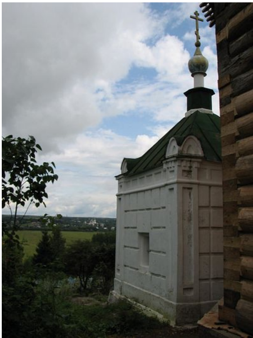
У часовни над могилой Ивана и Фотиньи, родителей преподобного Пафнутия в долине виден Пафнутьево-Боровский монастырь. Боровск. 2009 г.