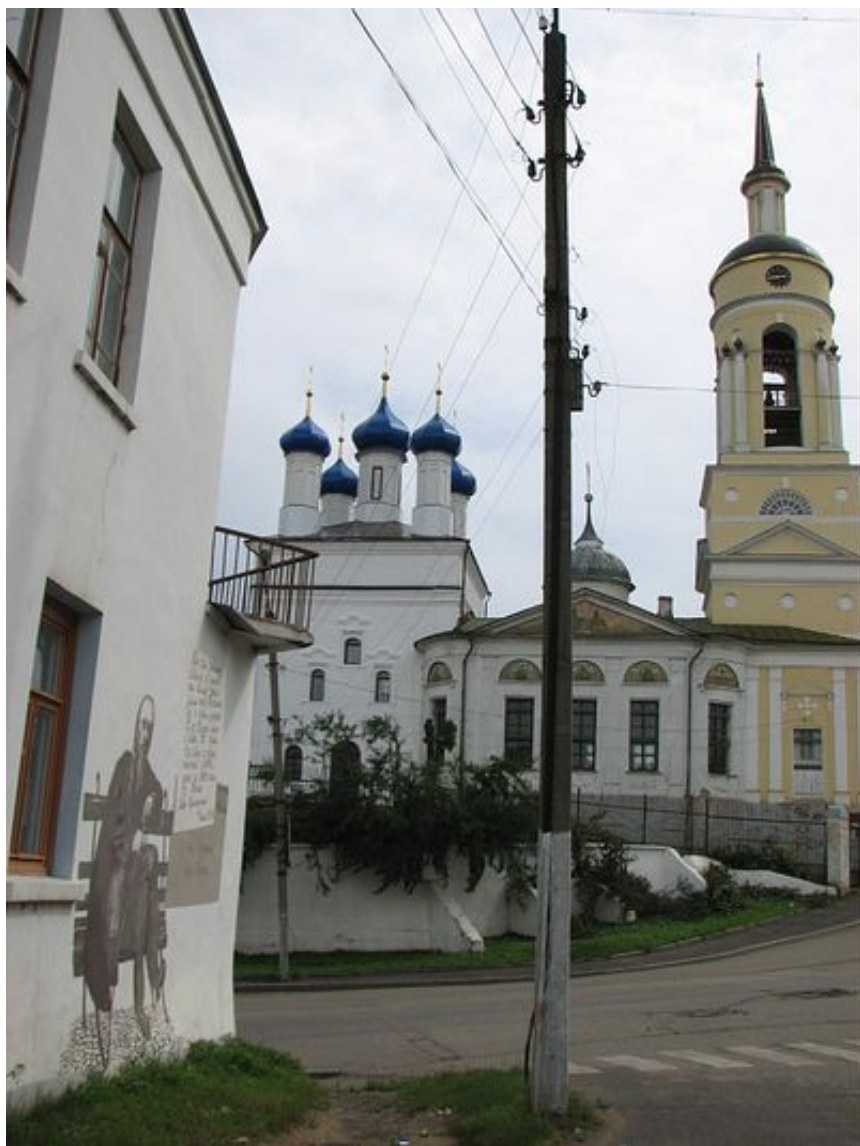
Благовещенская церковь в Боровске

Потому еще о Боровске и вспомнилось, что и памятник космисту К. Циолковскому в Боровске, и лик Пафнутия на иконе преподобного – устремляют взоры в Небеса.