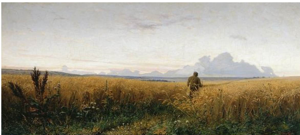
Г. Г. Мясоедов. Дорога во ржи. 1881 г.

Они чем-то близки, поразительно аукаются, эти два образа: странник с картины передвижника Григория Григорьевича Мясоедова «Дорога во ржи» (1881), уходящий сквозь хлеба в небесную даль, и космическая станция МКС, парящая в безвоздушном пространстве над голубеньким Земным шариком. Величественное зрелище устремления к неизвестным пределам, для русского человека в первую очередь духовным. Вечный русский поиск. Похоже, русский человек и задуман как странник. Без Неба и движения к нему – внутреннего или внешнего – русский человек немислим.