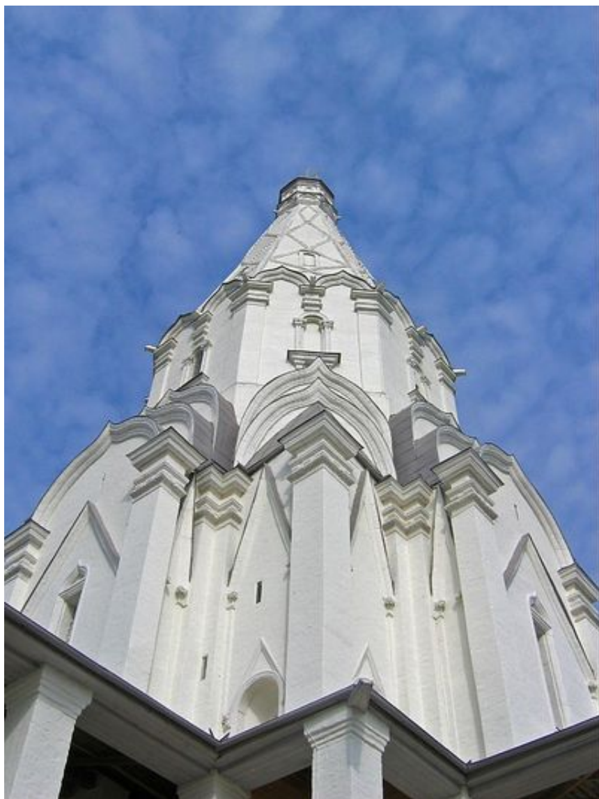
Церковь Вознесения в Коломенском