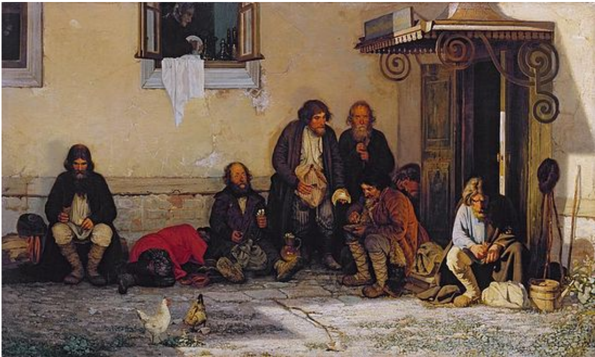
«Земство обедает» (1872)

Первая передвижная художественная выставка открылась 29 ноября 1871 года в Петербурге. Затем она была показана в Москве, Киеве и Харькове. Мясоедов представил на ней картину «Дедушка русского флота (Ботик Петра I)».