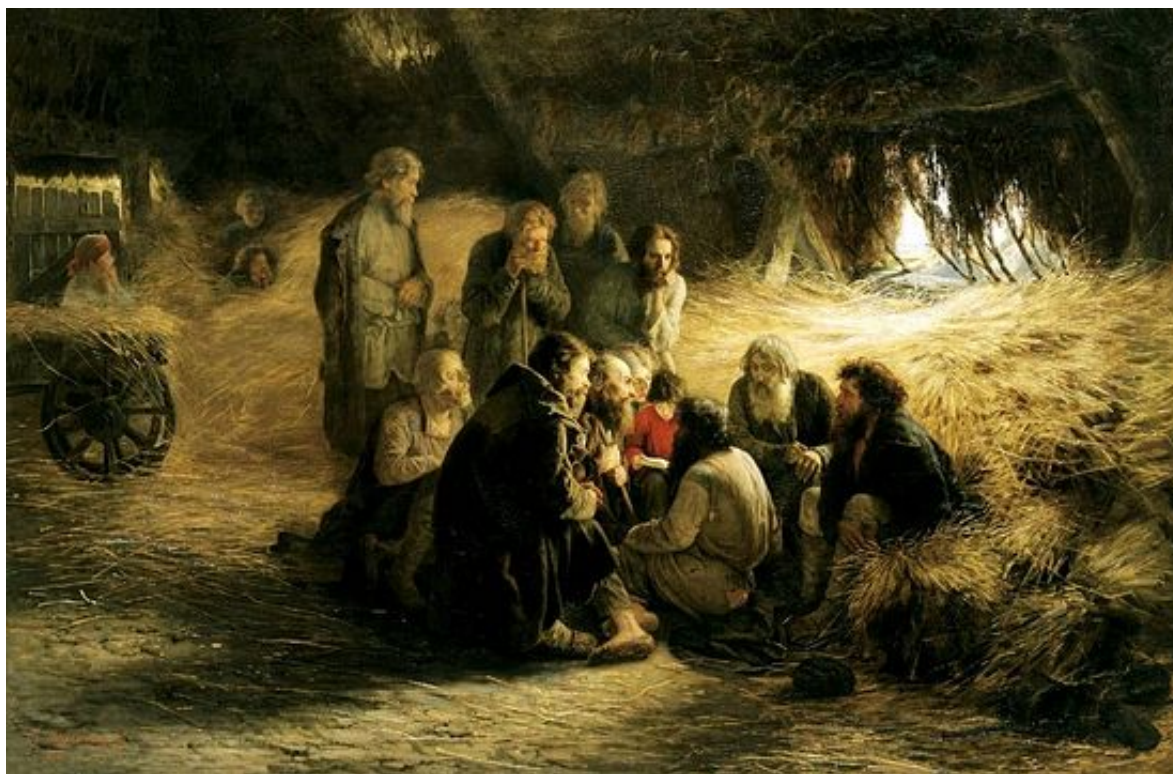
«Чтение манифеста 19 февраля 1861 года» (1873)

В другом фундаментальном полотне Мясоедова, «Чтение манифеста 19 февраля 1861 года» (1873) мы тоже видим крестьян. «Признаюсь, – писал один из критиков, – мне не удавалось видеть (после “Бурлаков” г-на Репина) ни на одной картине столь типичных, безыскусственно-правдивых, точно живых, истинно мужицких лиц». Крестьяне с сосредоточенным вниманием слушают читаемый мальчиком текст манифеста об освобождении от крепостной зависимости. Их отношение к документу еще не определилось: на лицах нет ни радости, ни явного разочарования. Но есть внутреннее напряжение, недоверие, настороженность. Крестьяне по-своему мудры и мужественны.