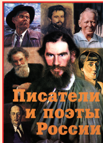
Комплекты плакатов издательства "Армпресс"

ученые, педагоги приходят в библиотечные стены, чтобы встретиться с читателями, организовать выставку, творческий вечер, концерт, прочесть лекцию, провести семинар, и делают это бескорыстно, бесплатно. По замечательной формуле Николая Федорова: "Жить нужно не для себя и не для других, а за всеми и для всех".